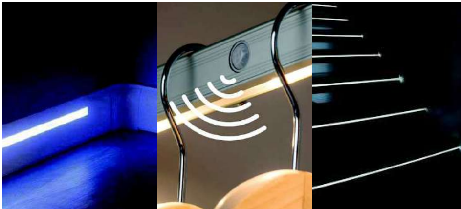
Chemin lumineux led

Iroise Adapt'Habitat , c'est l'aménagement de votre domicile autour de 5 univers : Hygiène / Ambulation / Eclairages intérieurs / Sécurité / Extérieur.